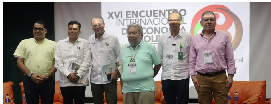
Representantes del gobierno local, departamental y nacional, estuvieron presentes en varios de los actos cruciales para la ciudad y para el sector cooperativo

Esta versión del encuentro además marcó la historia del continente con la firma del Pacto Latinoamericano por la asociatividad solidaria para la paz.