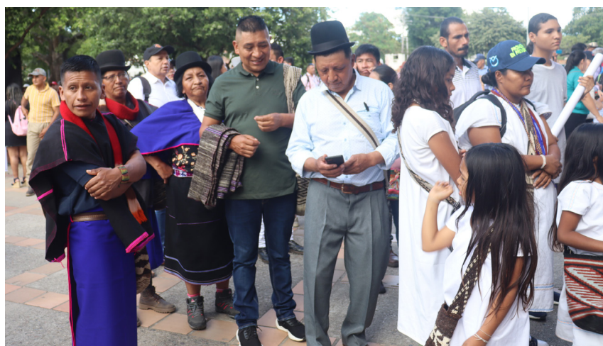
Es un nuevo Pacto Solidario, porque se trata de reconstruir los tejidos del trabajo colaborativo entre el Estado y el movimiento solidario.