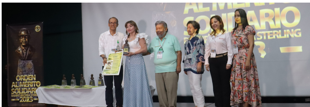
COOFACENEIVA, una cooperativa que ha contribuido a procesos de integración cooperativa y solidaria.