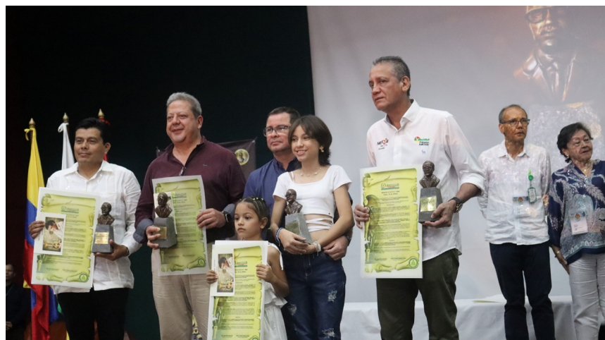
El apoyo de los gobernantes para la implementación de la economía solidaria es fundamental en las regiones.

El segundo momento estuvo a cargo del grupo cultural de Fundacoopaipe Güambitos Charrangueros que son unos jóvenes que promueven la preservación de la cultura y tradiciones de su municipio a través del cooperativismo y fortalecimiento de territorios solidarios.