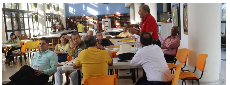
Con este evento el Huila se ratifica como el segundo departamento en Colombia en apostarle e implementar la economía solidaria.