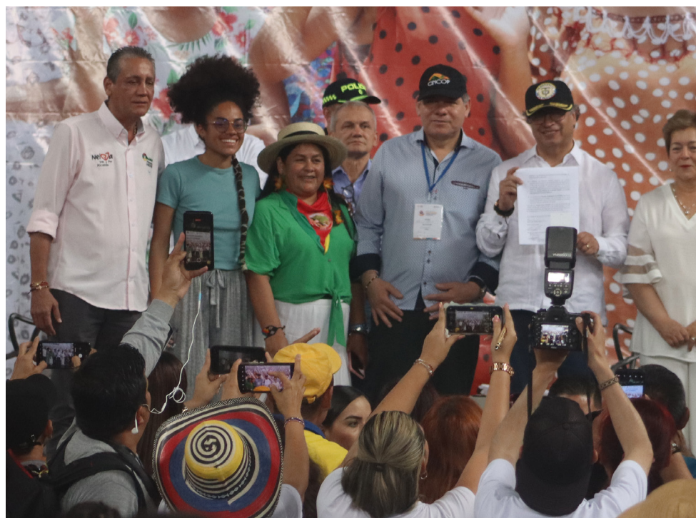
La propuesta recoge la voz de los gremios, organizaciones, plataformas y redes de la economía solidaria.

Luego el mismo presidente Gustavo Petro enfatizó en la necesidad de trabajar cooperativamente: “El Gobierno del Cambio, el gobierno que quiere hacer de Colombia una potencia mundial de la vida, prioriza el cooperativismo en Colombia, invita al pueblo colombiano a cooperativizarse económica y socialmente, queremos que los productores directos del campo, los que producen el arroz, los que producen la papa, los y las que producen la leche, las productoras del maíz, etc, se asocien para industrializarse, un campesino individualmente no puede lograr transformar que su maíz se vuelva hojuelas de maíz, pero los productores y las productoras de maíz de una región sí que pueden asociarse si el gobierno ayuda para poner una empresa fábrica que transforme su maíz, en hojuelas de maíz, lo mismo se puede hacer con la papa, lo mismo se