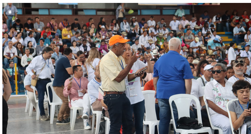
Para lograr el pacto se realizaron 23 Asambleas Regionales con 2500 organizaciones, que arrojaron más de 20 mil propuestas para la transformación de sus territorios.