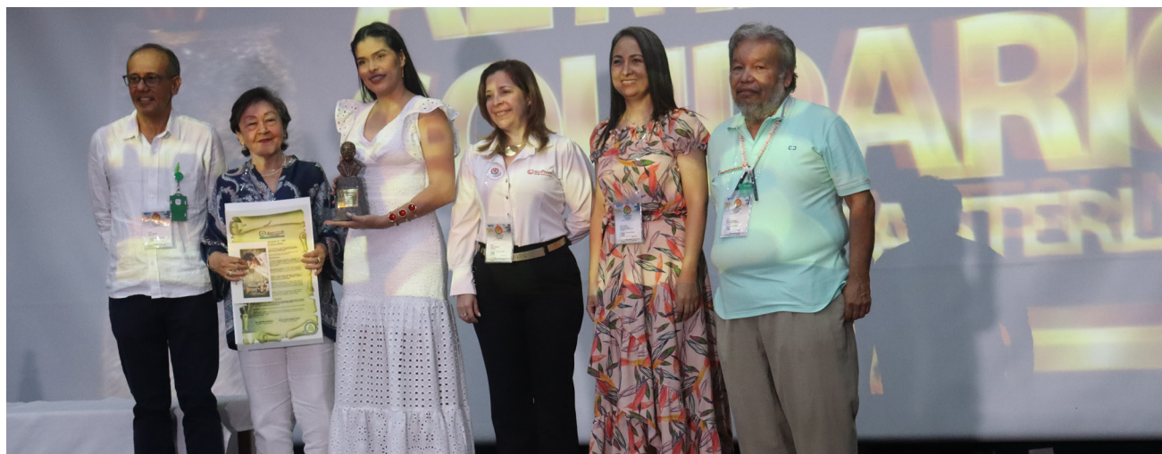
Gracias al compromiso de estos líderes el Huila es el segundo departamento a nivel nacional en cooperativismo.